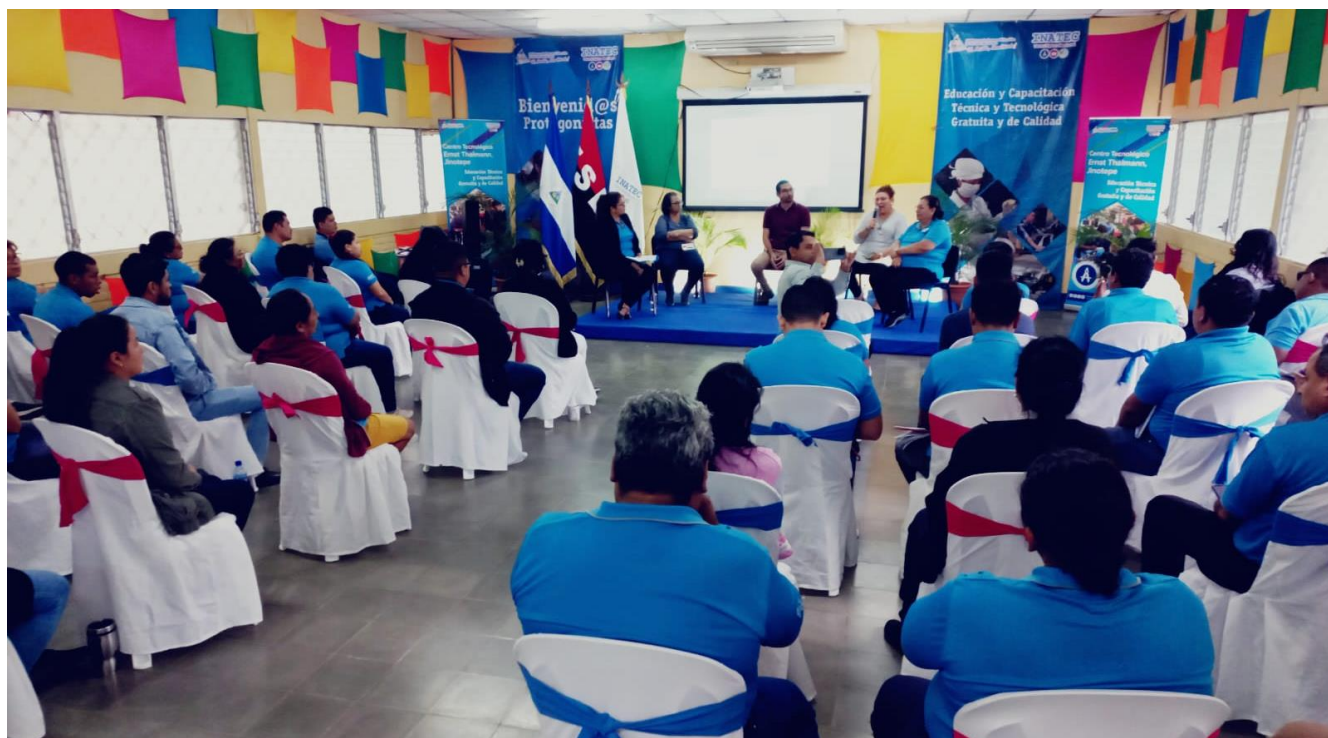
Encuentro departamental de apropiación de Ejes de la Estrategia Nacional de Educación en el Centro Tecnológico de Jinotepe, Carazo.