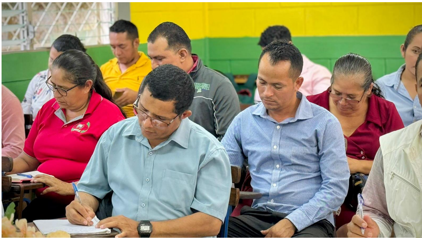
Espacio apropiación con Directores de centros educativos del MINED.