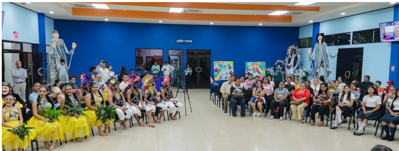
Encuentro sobre prácticas pedagógicas del arte y cultura, tradición e identidad nacional.