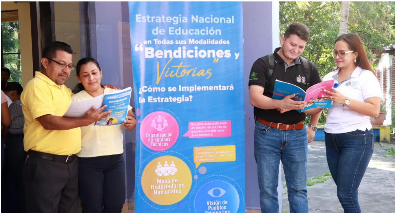
Espacio apropiación con estudiantes y personal académico de universidades del CNU.