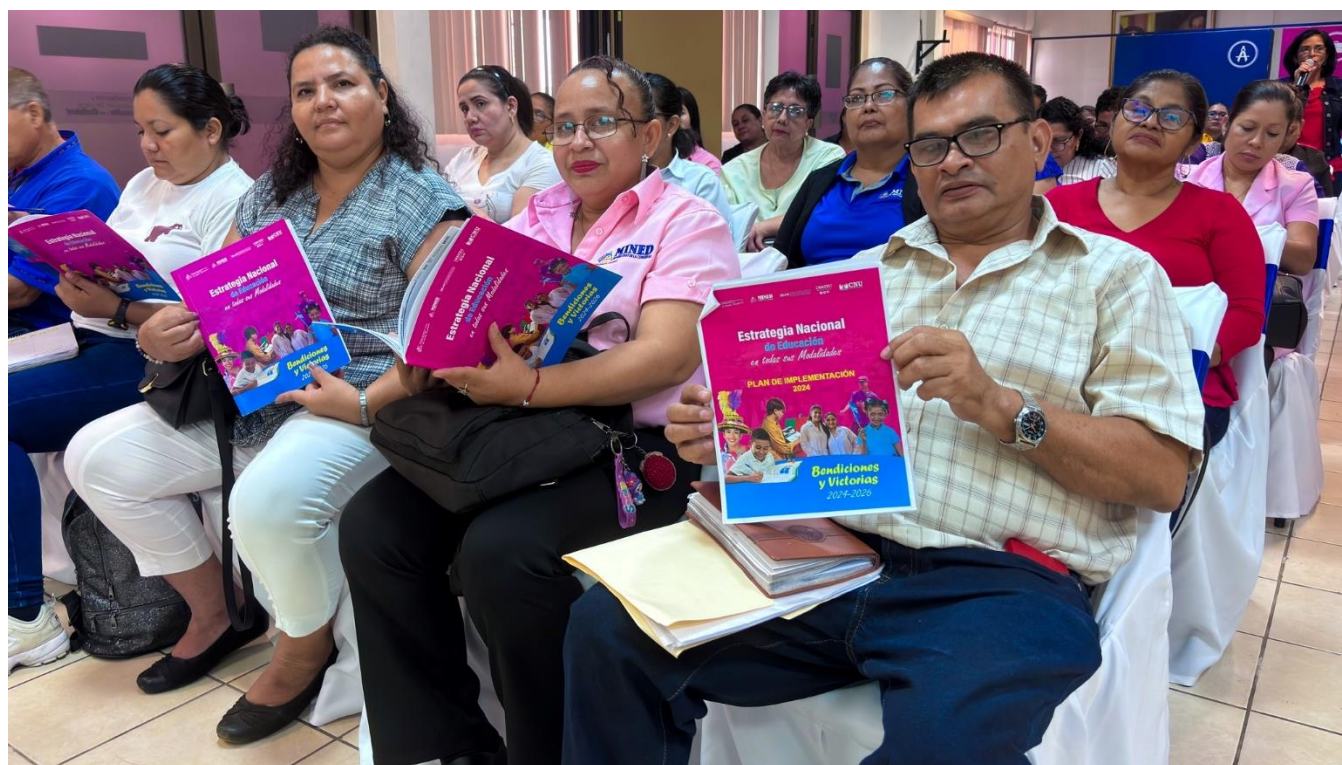
Espacio apropiación con Asesores Pedagógicos, Directores de Centros Educativos, Delegados Departamentales y Municipales del MINED.